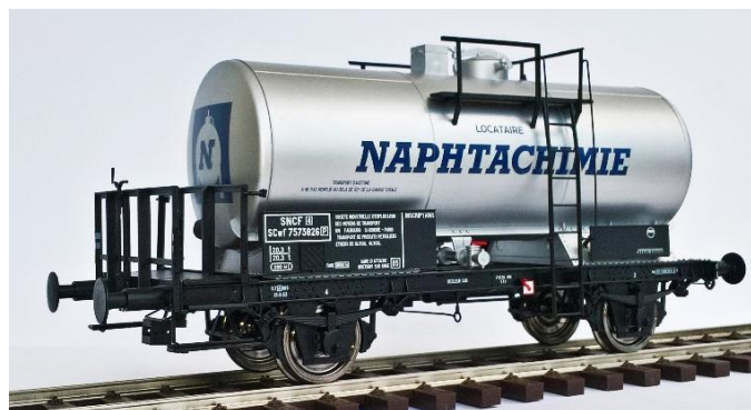
Réf. 37265 : SNCF / Naphtachimie, époque 3.