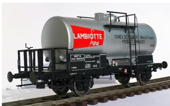
Réf. 37266 : SNCF / Lambiotte, époque 3.