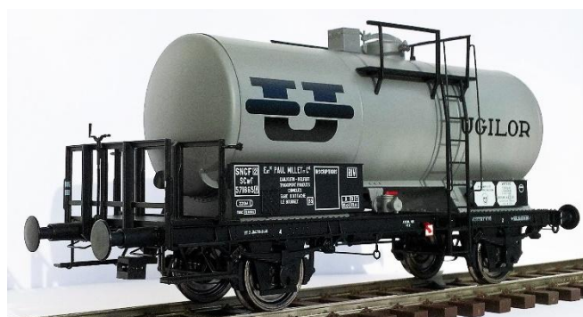
Réf. 37264 : SNCF / Ugilor, époque 3.