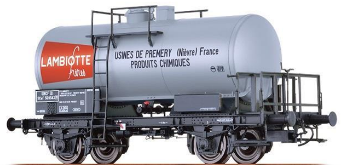
Réf. 37266 : SNCF / Lambiotte, époque 3.