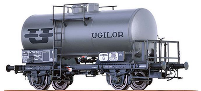
Réf. 37264 : SNCF / Ugilor, époque 3.