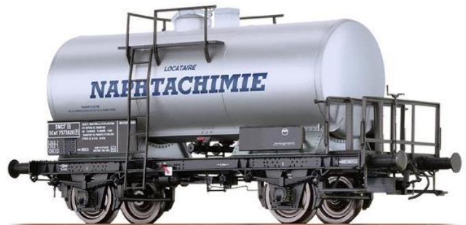
Réf. 37265 : SNCF / Naphtachimie, époque 3.