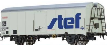
Référence 37216 : STEF époque 4, 129 €