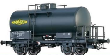
Références 37261 et 37262, époque 3: 115 €