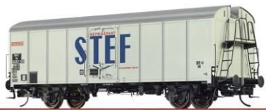
Référence 37215 : STEF époque 3, 129 €