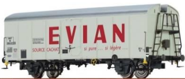
Référence 37214 : Evian époque 3, 129 €

BRAWA Quelques nouveautés SNCF 2016 seront disponibles à Rail-Expo :