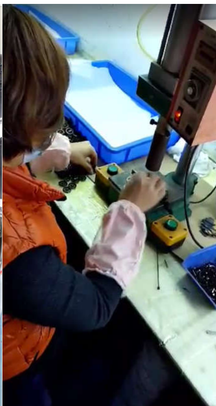
Quelques essieux de bissel avant !