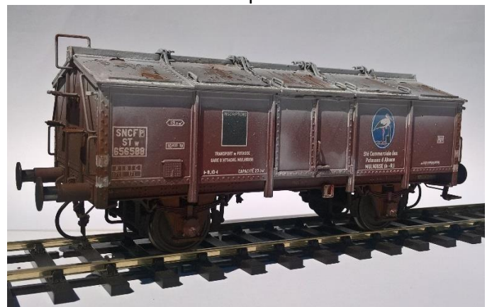
Prix : 169,00 TTC