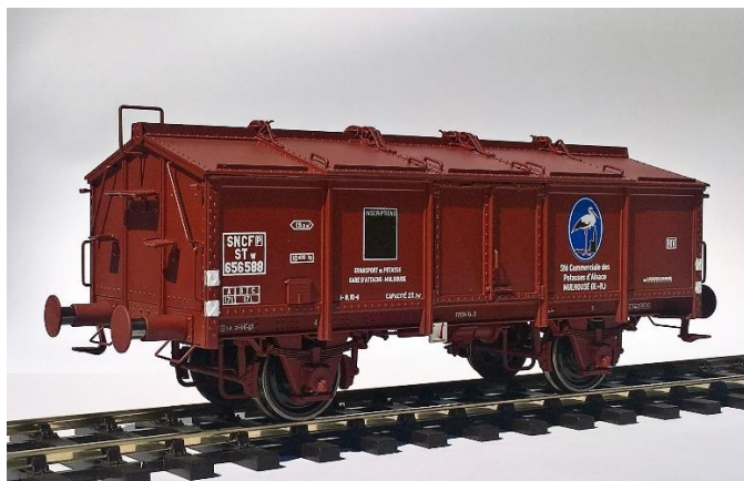
Prix : 149,00 TTC